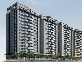
【東方悅】·北屯區水岸臻美宅