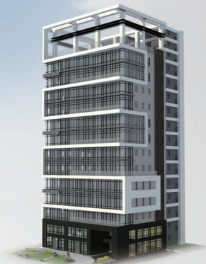
【TTC 未來駅】·台中高鐵商質中心